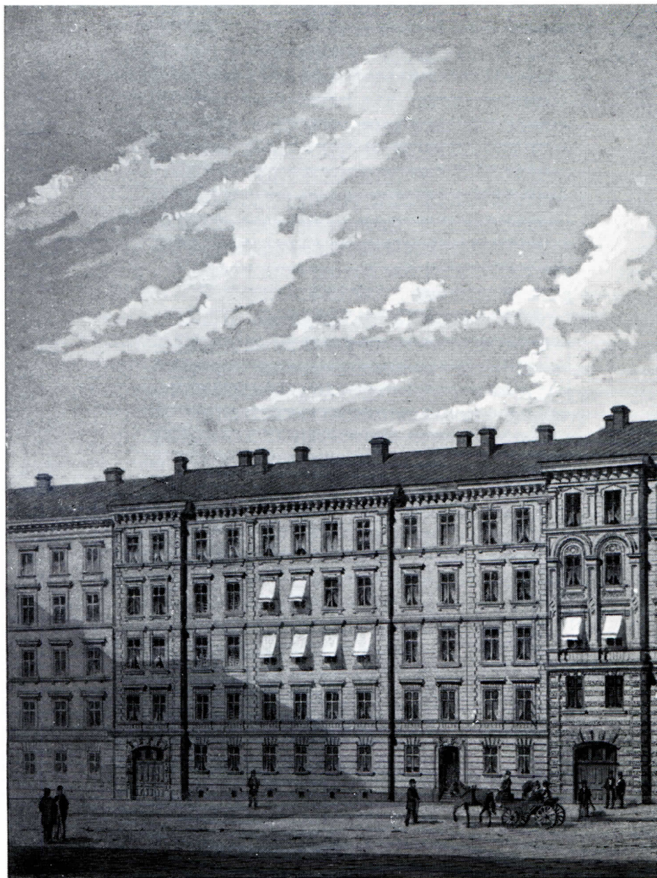
S. B. F:s böningshus vid Prästgårdsgatan, byggt efter arkitekten C. Cederströms ritning åren 1884—1885